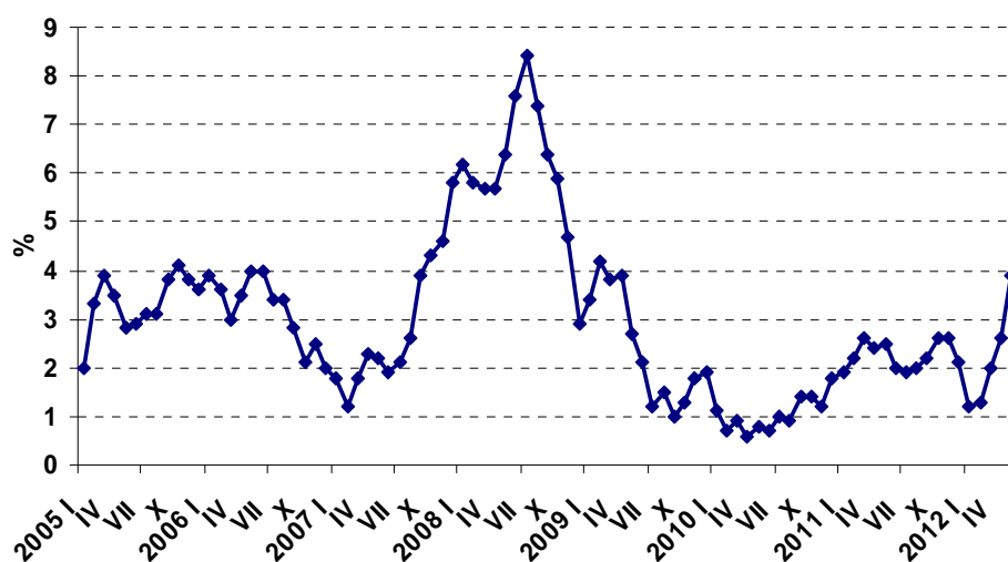
Grafikon 2: Indeks potrošačkih cijena, međugodišnja promjena

Međugodišnji rast indeksa potrošačkih cijena iznosio je 3,9% u svibnju 2012. godine. Najveći doprinos rastu potrošačkih cijena na međugodišnjoj razini u svibnju došao je od cijena električne energije koje su ostvarile međugodišnji rast od 25,0%, zatim od cijena plina (rast od 30,8%), cijena prehrane (2,6%), čemu je najviše doprinio rast cijena mesa (6,3%), cijena goriva i maziva za osobna vozila (5,3%) te od cijena duhana (4,3%). Najveći utjecaj na ublažavanje međugodišnjeg rasta cijena tijekom svibnja 2012. godine imale su cijene telefonske i telefaksne opreme i usluga koje su smanjene 5,8% te cijene odjeće (-4,5%). U usporedbi s travnjem 2012., indeks potrošačkih cijena je u svibnju povećan 1,7%, ponajviše uslijed rasta cijena električne energije od 19,8% i rasta cijena plina od 22,0%. U prvih pet mjeseci 2012. godine prosječna inflacija je iznosila 2,2%.