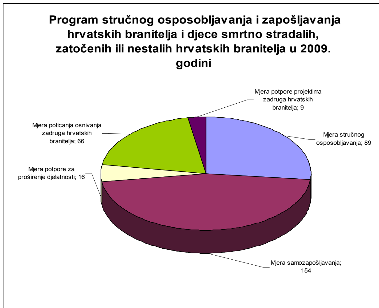
Grafikon 2. Realizacija Programa stručnog osposobljavanja i zapošljavanja hrvatskih branitelja i djece smrtno stradalih, zatočenih ili nestalih hrvatskih branitelja u 2009. godini

Slijedom navedenoga, do sada je kroz provođenje svih mjera Programa stručnog osposobljavanja i zapošljavanja hrvatskih branitelja i djece smrtno stradalih, zatočenih ili nestalih hrvatskih branitelja u 2009. godini omogućeno zapošljavanje više od 1 154 osoba iz ciljne skupine.