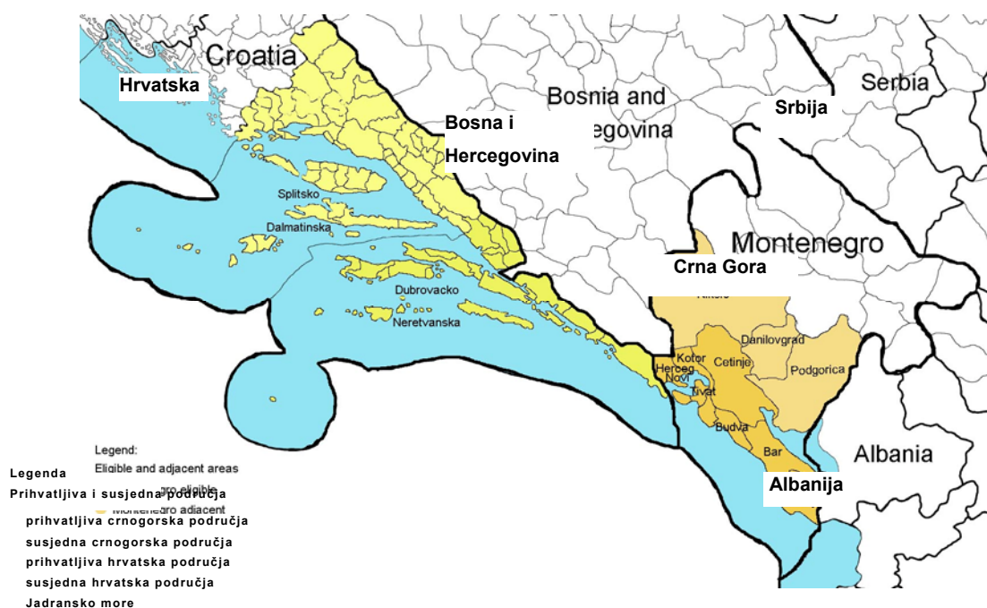
Mapa 1: Prihvatljiva i susjedna područja za Hrvatsku i Crnu Goru