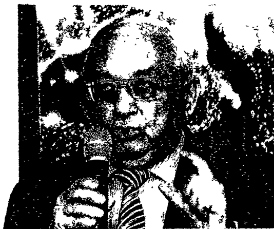
"Hrvatski me ministri vole jer sam vrlo izravan i otvoren te ostvarim ono što obećam", kazao je Azimov

te kako dobro zarađuju poslujući s nama – Srbija, Mađarska, BiH. U rafineriju Pančevo uloženo je 600 milijuna eura, a uložiti će se još toliko. Želimo ulagati u Hrvatsku, ali za to mora postojati politička dobra volja. Uvjereni smo da Rusija može više učiniti za Hrvatsku nego SAD i EU zajedno – dodao je veleposlanik. Upitan za otkup Ine, Azimov je rekao da se tom idejom Gazprom bavio prije nekoliko godina, "no 2015. je to bilo odbijeno. Učinjeno je to zbog raznih razloga, možda i političkih, odabrana je druge tvrtka iz druge zemlje. I Rosnjeft tu ima interesa, ali to ovisi o MOL-u i Hrvatskoj. Mi smo spremni, ali čekamo odgovor MOL-a i hrvatske strane. Na pitanje ima li nekih skrivenih motiva u energetskom sektoru, Azimov je rekao „ne, mi nemamo