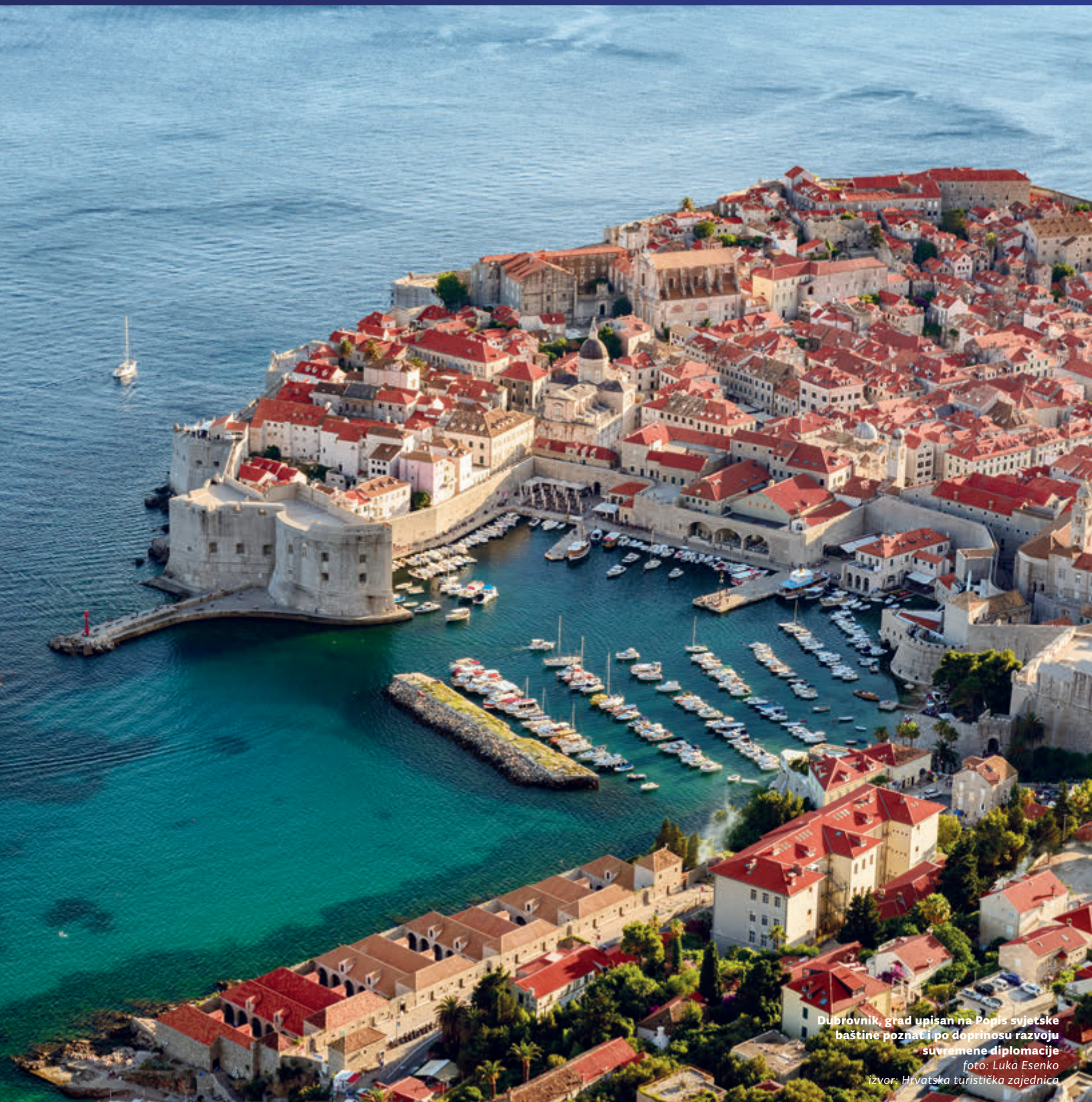
Dubrovnik, grad upisan na Popis svjetske baštine poznat i po doprinosu razvoju suvremene diplomacije