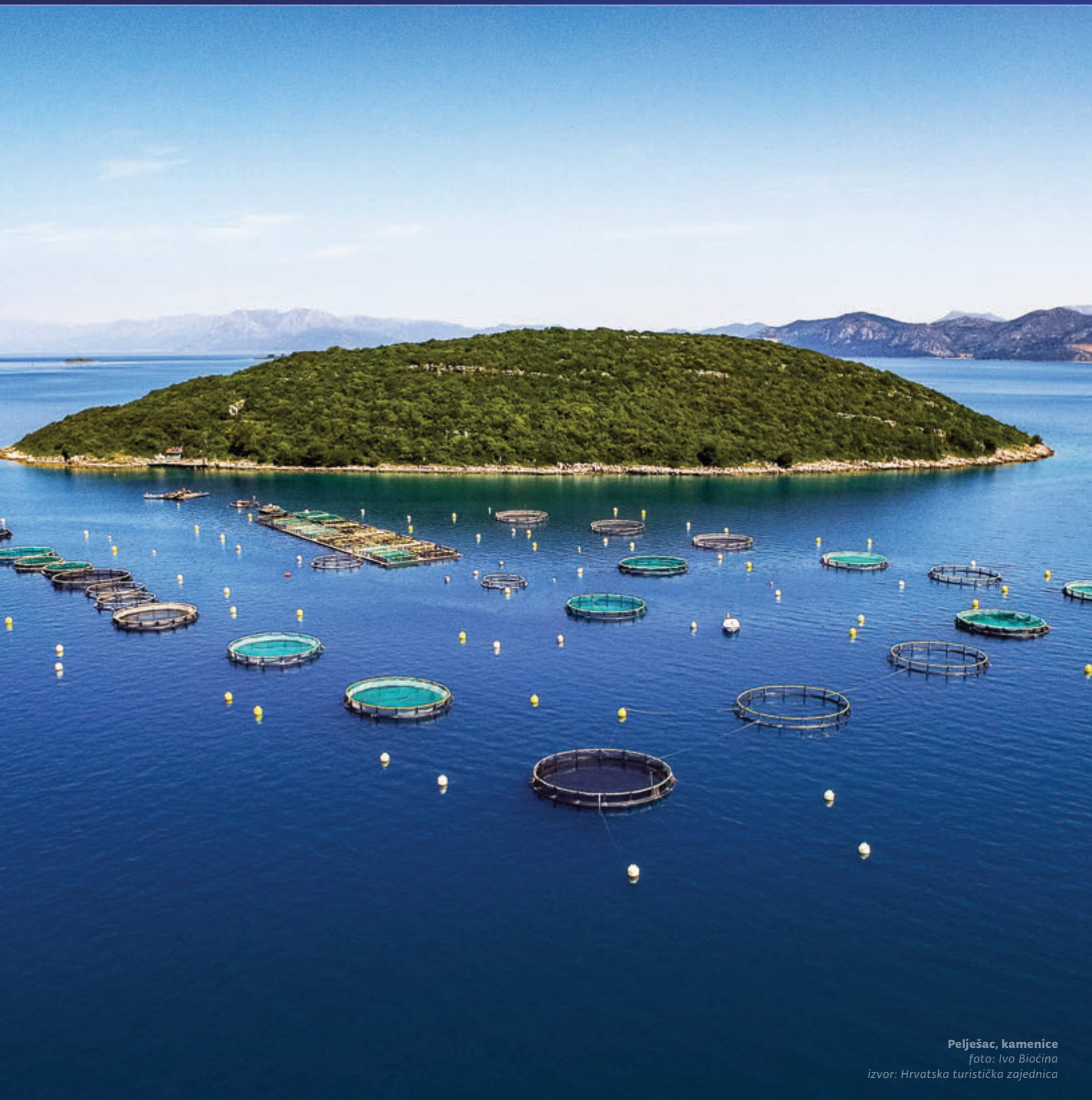
Pelješac, kamenice