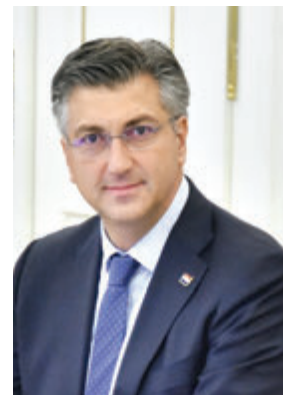
Andrej Plenković predsjednik Vlade

Od 1. siječnja do 30. lipnja 2020. Hrvatska će prvi put predsjedati Vijećem Europske unije. Tijekom šestomjesečnog razdoblja Hrvatska će voditi rad Vijeća kao pošten i neutralan posrednik, gradeći suradnju i dogovor među državama članicama u duhu konsenzusa i međusobnog uvažavanja.