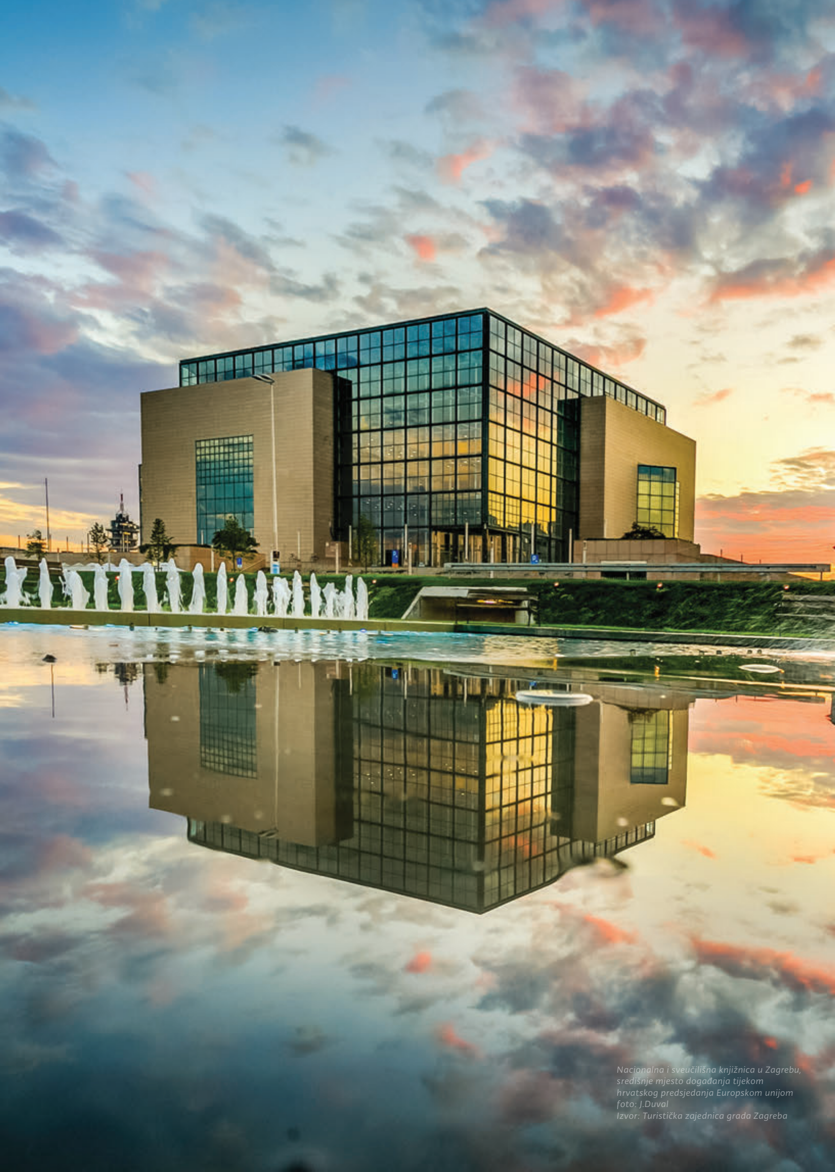
Nacionalna i sveučilišna knjižnica u Zagrebu, središnje mjesto događanja tijekom hrvatskog predsjedanja Europskom unijom