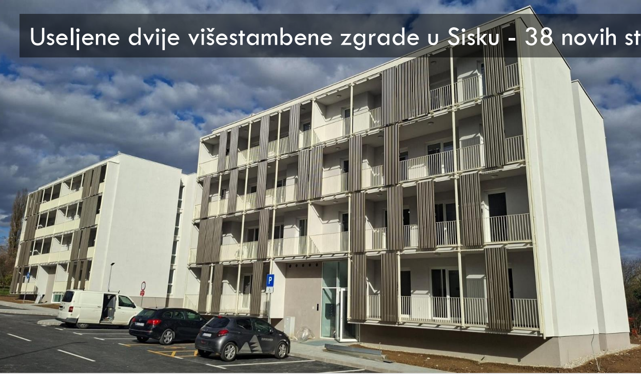
Useljene dvije višestambene zgrade u Sisku - 38 novih stanova