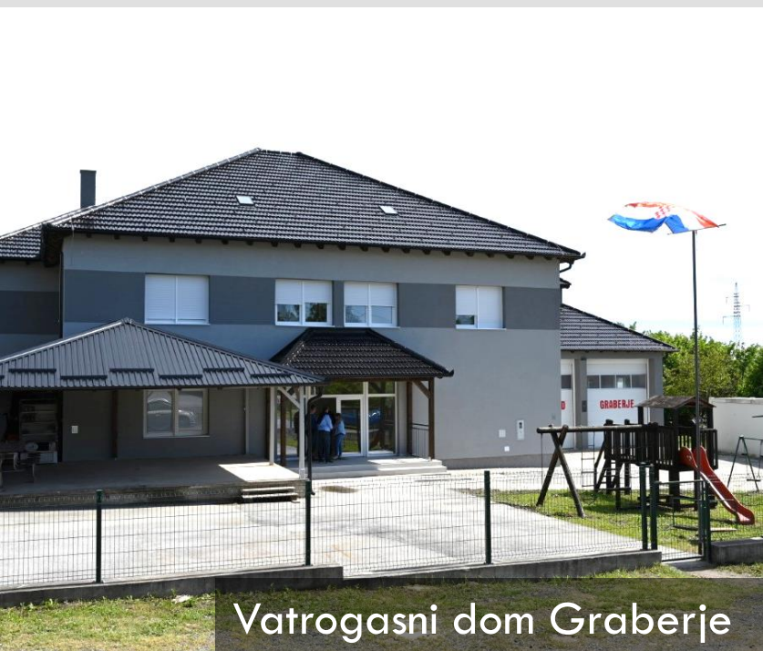
Vatrogasni dom Graberje