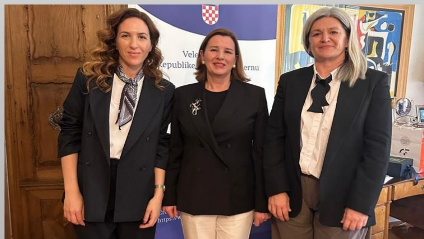
Hrvatska iskustva o obnovi predstavljena u Posočju, u Bernu potpisan Sporazum o primijenjeno-istraživačkom projektu razvoja strategije obnove blokova povijesnih zgrada u Zagrebu - započeo projekt ZAGGREGATE.