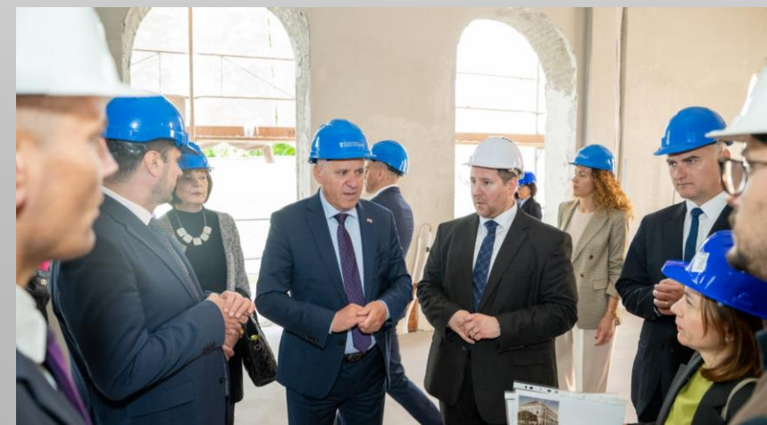
Obilazak gradilišta energetske i poslijepotresne obnove u Glini i Sisku