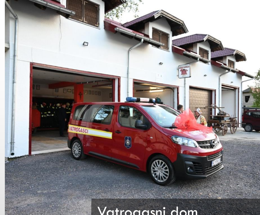
Vatrogasni dom Kratečko