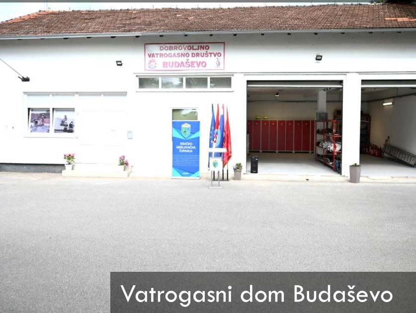
Vatrogasni dom Budaševo