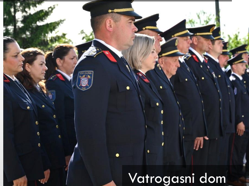
Vatrogasni dom Novo selo Glinsko