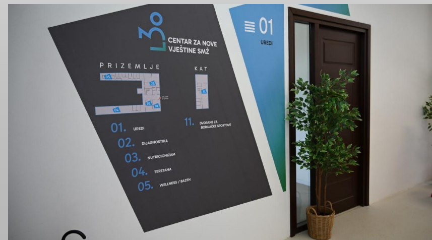
U Sisku se otvara moderan obrazovno-sportski centar