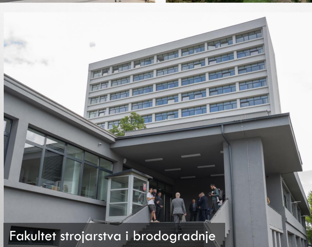
Fakultet strojarstva i brodogradnje