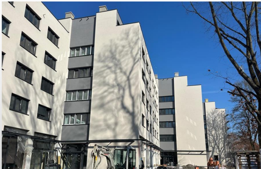
Blok HNP u Sisku