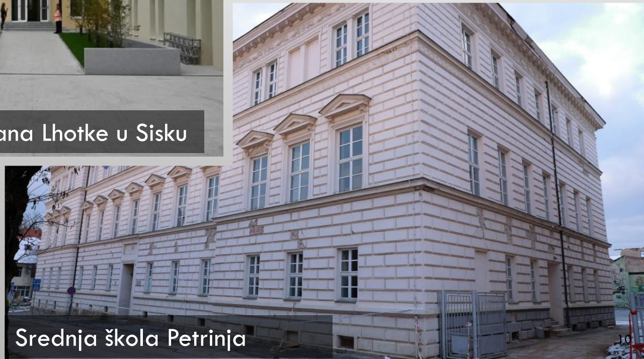
Srednja škola Petrinja