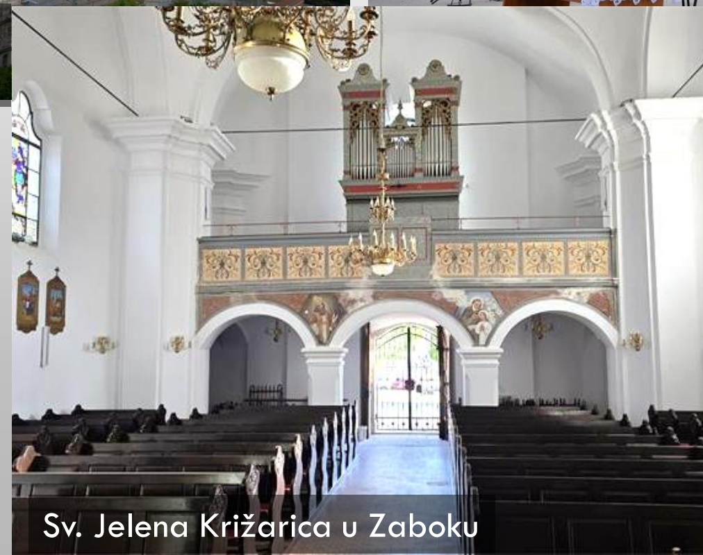
Sv. Jelena Križarica u Zaboku