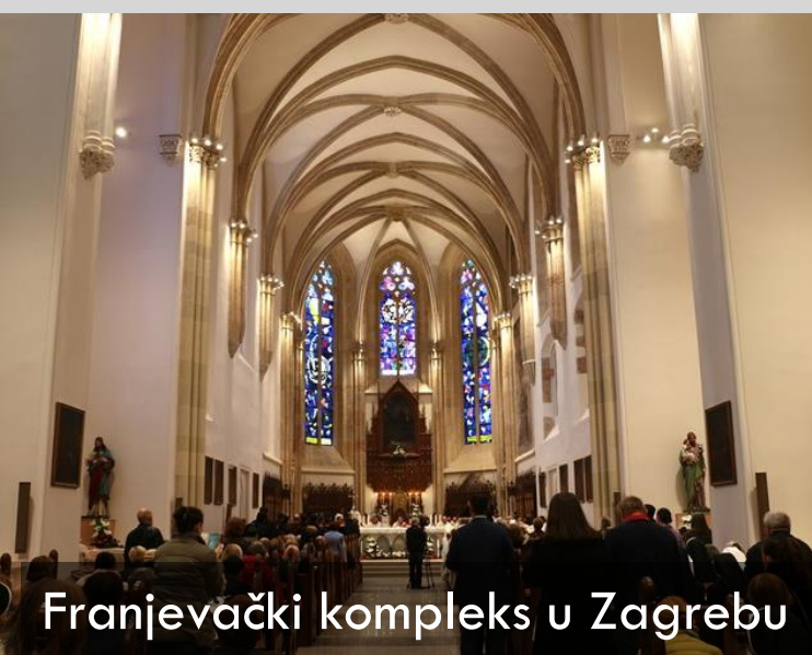
Franjevački kompleks u Zagrebu