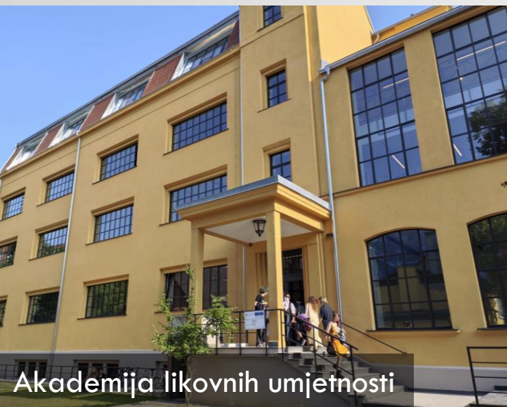
Akademija likovnih umjetnosti