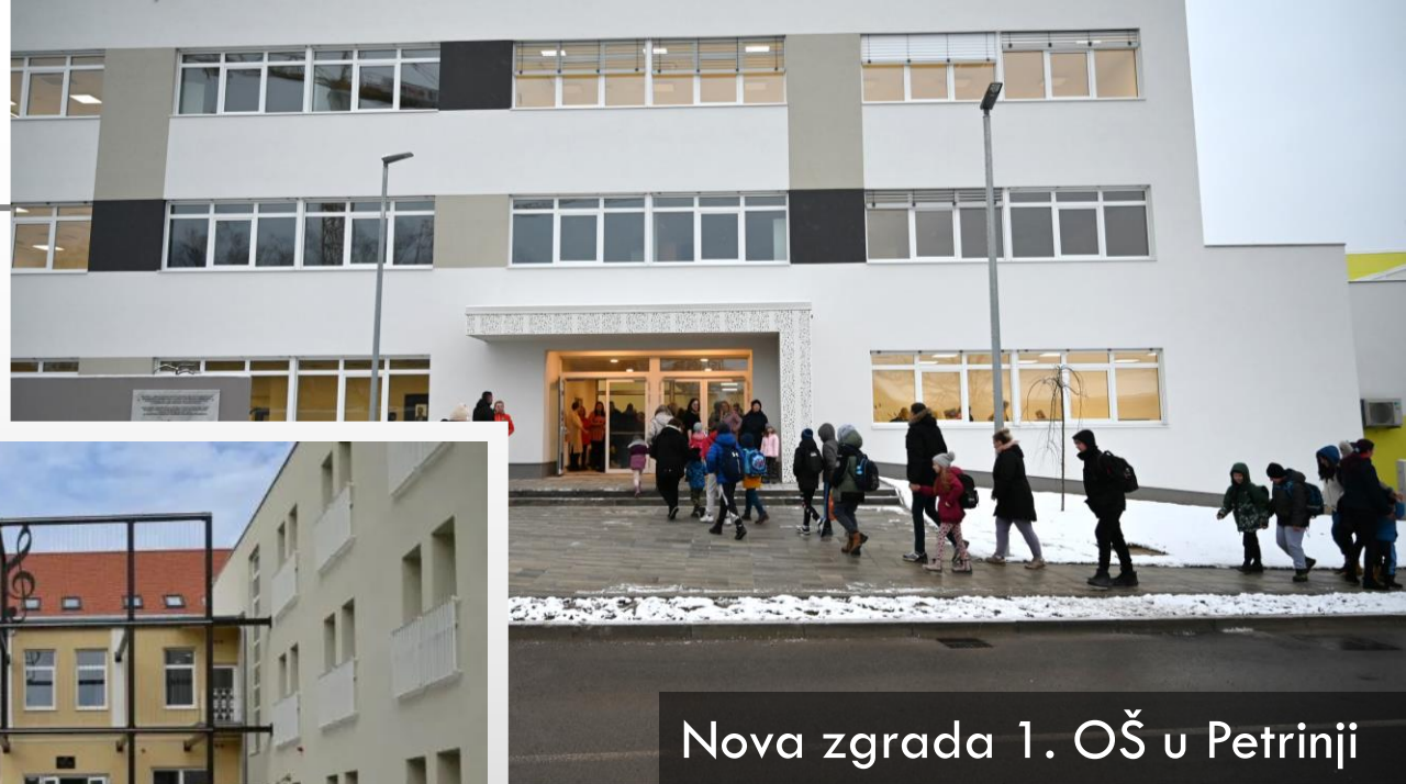
Nova zgrada 1. OŠ u Petrinji