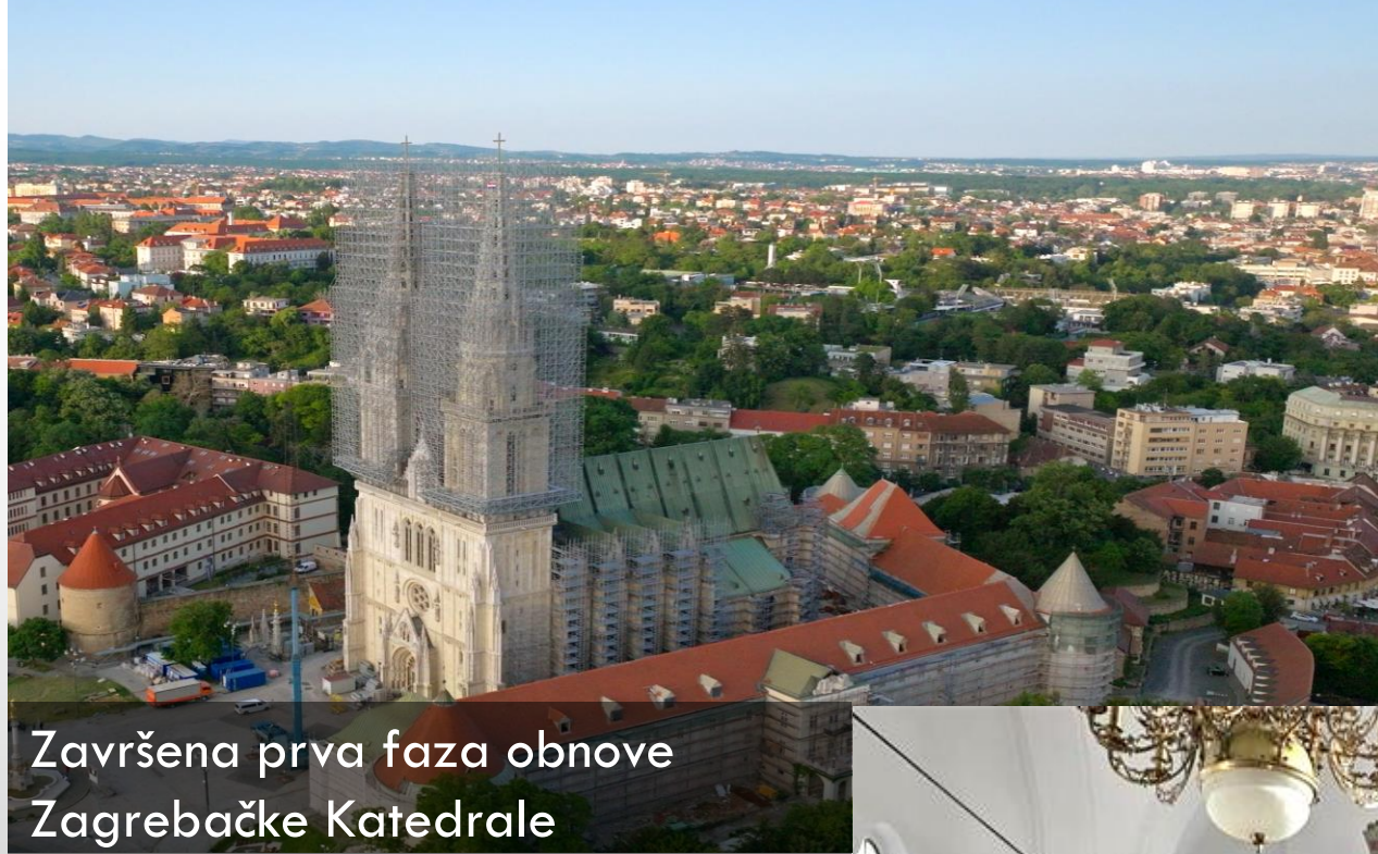
Završena prva faza obnove Zagrebačke Katedrale