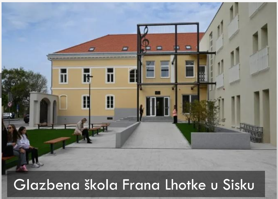
Glazbena škola Frana Lhotke u Sisku