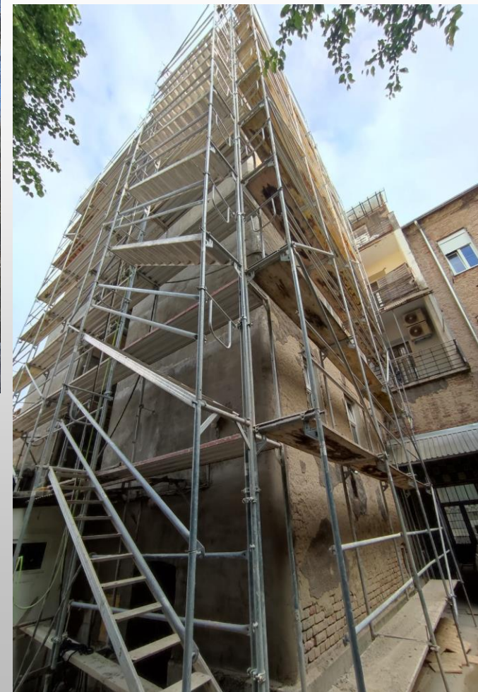
Blok 20 u Zagrebu