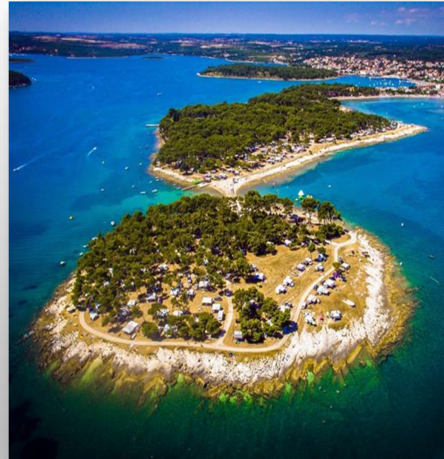
Kamp Medulin, Medulin