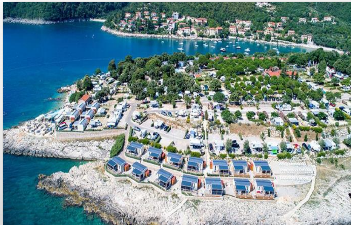
Kamp Marina, Labin