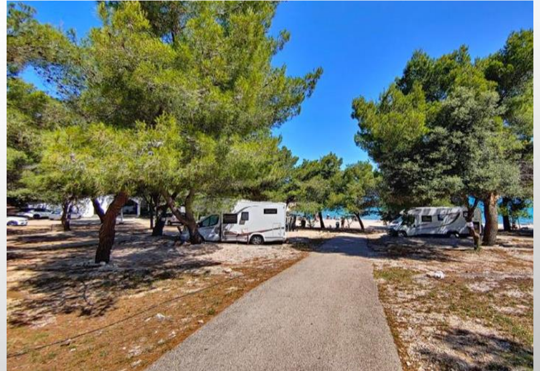
Kamp Jazina, Tisno