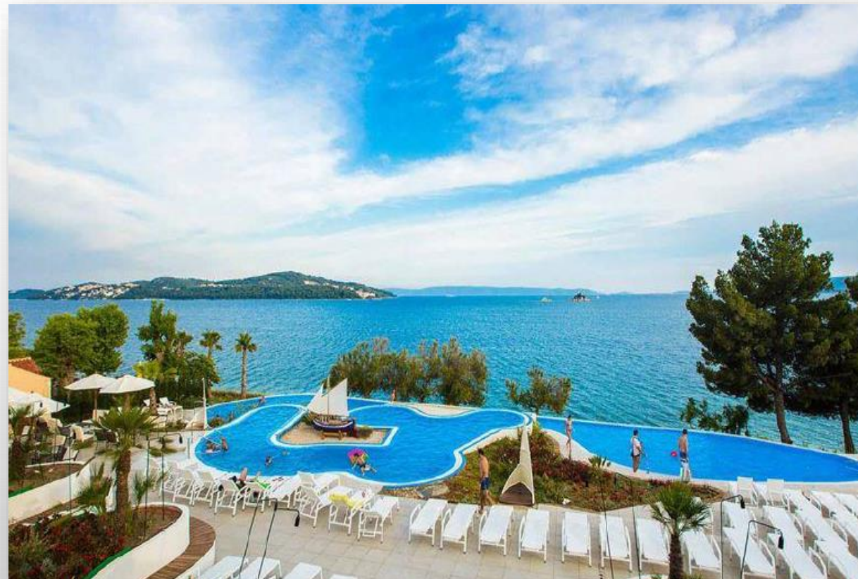
Kamp Vranjica Belvedere, Trogir