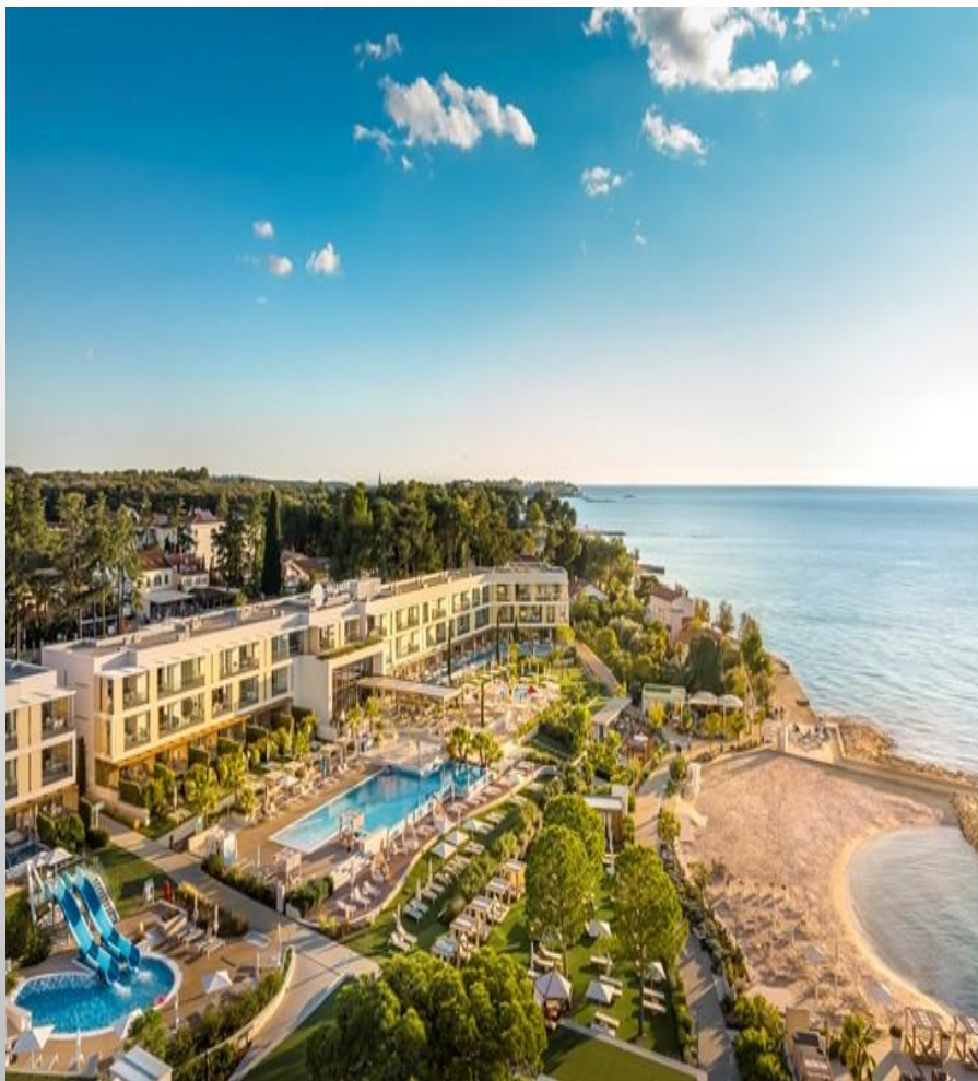
Hotel Marea Valamar, Poreč