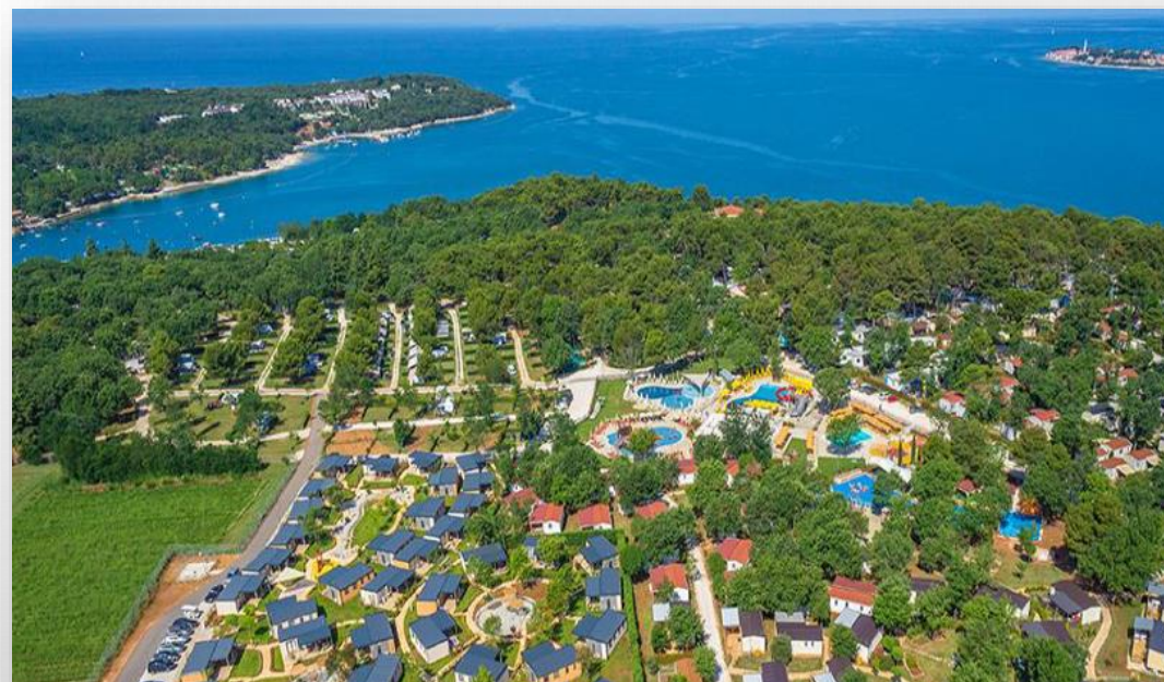
Kamp Lanterna, Novigrad

Iznos jedinične cijene zakupnine umanjuje se dodatno: